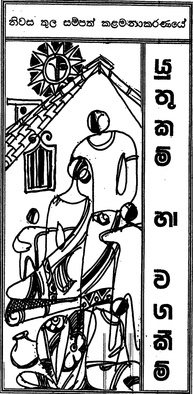
නිවස තුල සම්පත් කළමනාකරණයේ

වන සම්පත් හා පරිසර අමාත්‍යාංශය. පත්‍රිකා අංක 6/97